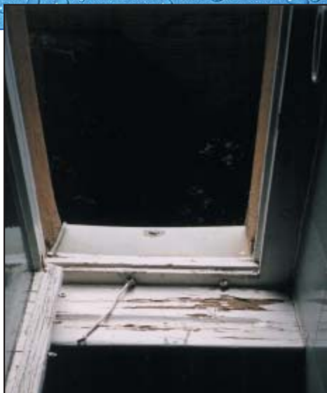
Ventana con fugas - el moho está empezando a crecer en el marco de madera y en el apoyo de la ventana.

Si ya tiene un problema con el moho — ACTÚE RÁPIDAMENTE.