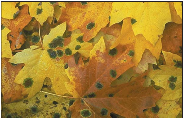
Moho creciendo en hojas caídas.

Se puede obtener este documento del sitio Web de la División para Medio Ambientes Interiores, EPA en www.epa.gov/iaq/molds/moldguide.html