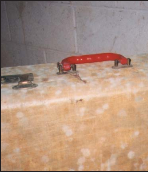
Moho creciendo en una maleta guardada en un sótano húmedo.

Es importante tomar precauciones que limiten su exposición al moho y a las esporas de moho.