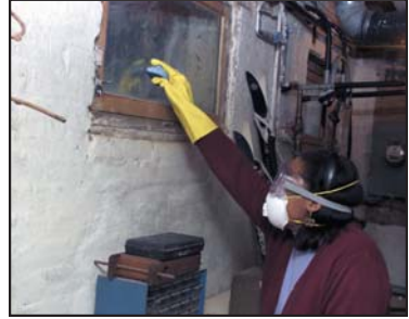
Persona limpiando con respirador N-95, guantes y gafas de protección.