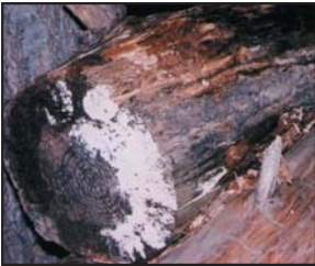
Moho creciendo sobre leña al exterior. Los mohos tienen varios colores, esta foto enseña ambos mohos blanco y negro.

¿Por qué crece el moho en mi hogar? Los mohos forman parte del medio ambiente natural. Al exterior, los mohos juegan un papel en la naturaleza al desintegrar materias orgánicas tales como las hojas que se han caído o los árboles muertos. No obstante, al interior, es necesario evitar el moho. Los mohos se reproducen mediante esporas; las esporas son invisibles a simple vista y flotan en el aire exterior e interior. Las esporas de mohos se hallan normalmente presentes en el aire exterior e interior. El moho puede crecer al interior cuando las esporas caen sobre